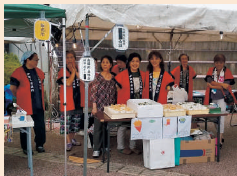
第3回志佐夜市出店