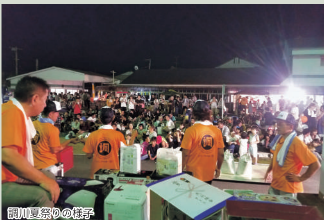
調川夏祭りの様子