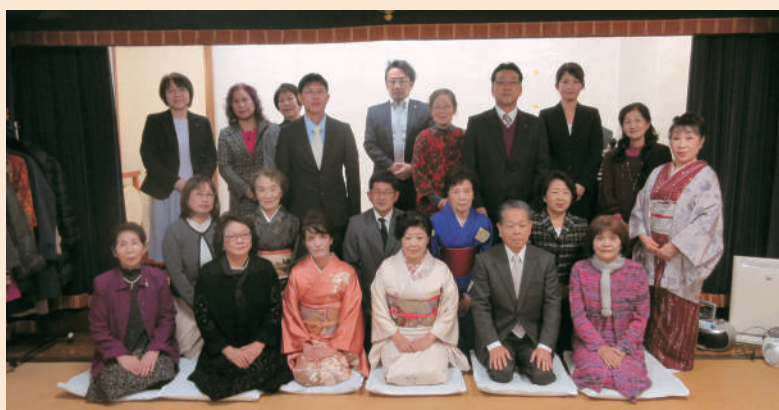
平成30年度松浦商工会議所女性会新年会