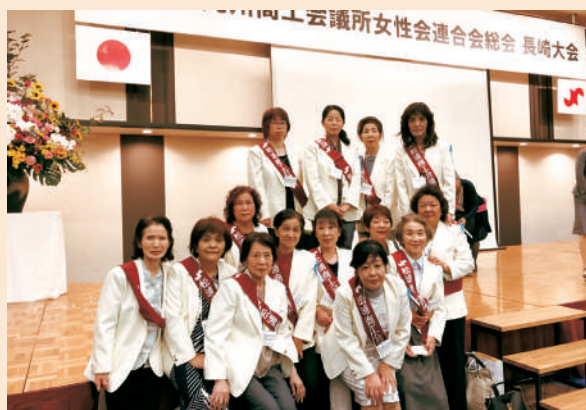
第51回九州商工会議所女性会連合会総会長崎大会