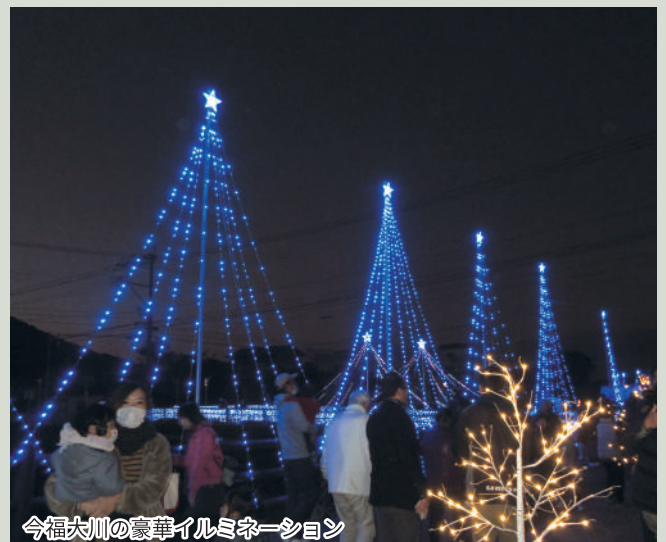
今福大川の豪華イルミネーション