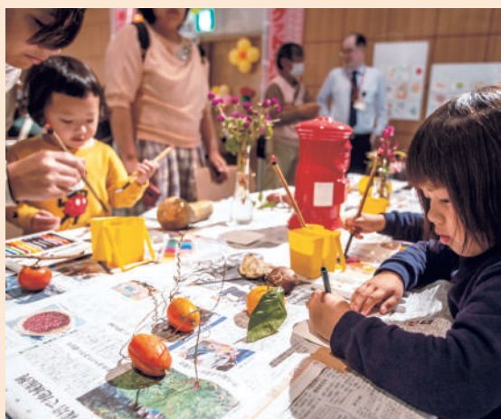
第4回 松浦子ども博 会場の様子