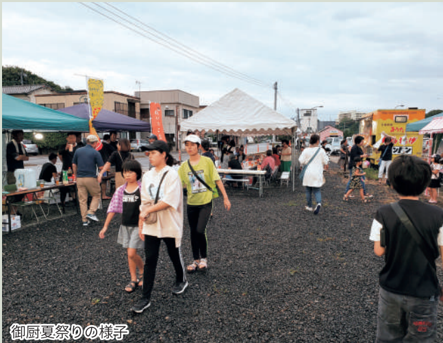
御厨夏祭りの様子