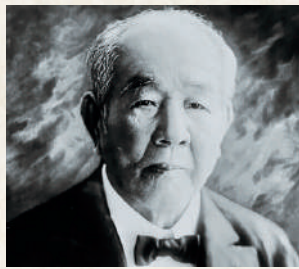
東京商法会議所 初代会頭 渋沢 栄一

商工会議所の母体は、中世より近世にかけて西欧諸都市において商工業者の間で結成された「ギルド」だといわれています。世界初の商工会議所は、1599年のフランスのマルセイユに組織されたマルセイユ商業会議所。日本においては、1878（明治11）年、東京、大阪、神戸の3箇所にも商法会議所として設立されたのが始まりです。